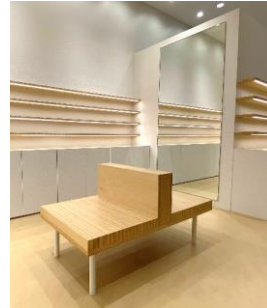
選定中の商品を置ける仕様のベンチ