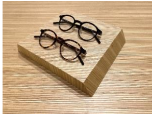
オリジナルのディスプレイ台や商品棚は、北海道産シラカバ間伐材を使用した合板の断面を積層したデザイン