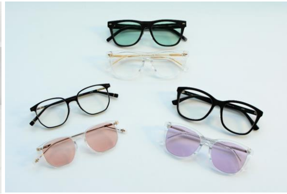
同店限定商品（一部に rim of jins 限定カラーレンズを組み合わせています）